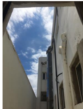
公寓窗外的蓝天白云

章，小视频什么的。网络上课和日常授课完全不一样，志愿者们都使尽浑身解数，通过电脑屏幕抓住孩子们的心，秒变播主。四月底，我们还收到了来自瓦伦西亚中国工商联合会捐赠的一些医用口罩，保证每个老师手中都有了口罩，这真是雪中送炭。现在生活开始变得有条理了，心也踏实多了。人间芳菲四月天，这个四月我们虽然在家，但这是为了更好的五月，期待来年的人间四月天。