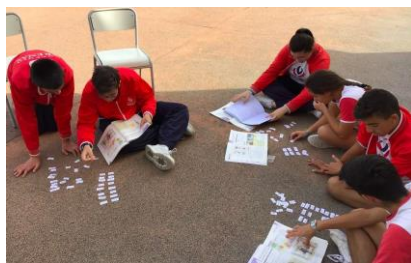
学生在室外做拼词卡活动

的中国留学生受同学劝解，也没来上课；平时碰到我会跟我一起爬半山公路去学校，被我当作朋友的老师跟有车的老师搭伙了，不再理我；办公室里坐在我对面的同事以前挺好的，却不合时宜地在别的位置上办公；各种不利于海外华人的消息接踵而至，再加上担心家人，我感觉自己一下跌到了低谷。一天之内突然发生了这么多事，我的脑袋里嗡嗡作响，我默默地，忍住所有的憋屈。