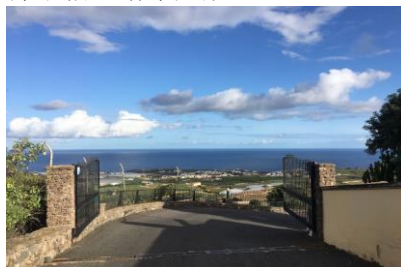
阿莱纳斯中学大门

罩，因为口罩是病人和有需要的人戴的。左右为难的情况下，我们只好入乡随俗，哪怕上下班的途中也忍住不戴口罩，尽量坐在公交车通风口附近或者站着。虽然每天冒着随时可能被感染的危险去工作，但没有听到孔院老师们任何抱怨的声音，大家依旧坚守在各自的岗位上。我还协助院长终于给孔院每个老师买到了一个口罩，着实让我们心里踏实了一整子。在家人朋友劝解我们回国的时候，我们却坚定地对父母说：“我们是坚守在前线的抗疫勇士，我们是海外抗议逆行者，是这段特殊历史的见证者，有祖国、驻西大使馆、孔院总部和国内派出院校这些坚强的后盾保护着我们，我们什么都不怕，请家人放心。”